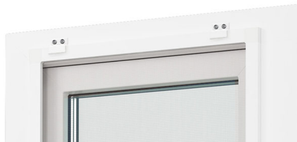
Рис.3. Сетка на внешних z-кронштейнах